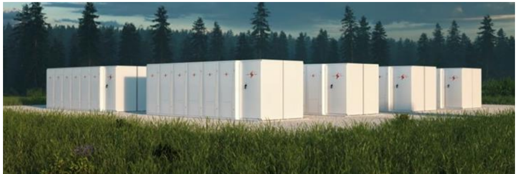
OX2:s projekt Bredhälla