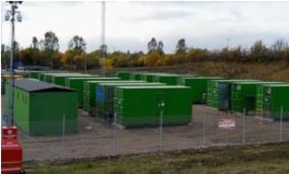
Vinnergi AB:s projekt Uppsala